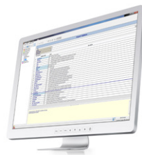
LIMS Software Interface

เครื่องวิเคราะห์ สเปกตรัม FT-NIR ใน ห้องปฏิบัติการสำหรับ การใช้งานหลากหลาย