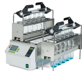
SpeedDigester K-439 / K-425 / K-436

ระบบจัดการข้อมูลผลกา วิเคราะห์ แบบอัตโนมัติ