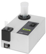
Sample Loader M-569 효율적인 모세관 패킹