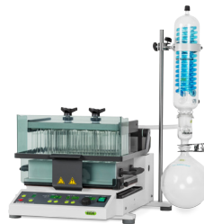
Syncore® Polyvap 다수시료의 동시농축