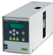
UV-Vis Detector C-640 자외선/가시광선 검출