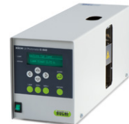
UV-Vis Detector C-640 자외선/가시광선 검출