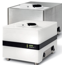
NIRMaster™ IP54 / Pro IP65 FT-NIR 분광기