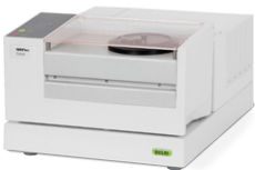
NIRFlex® N-500 실험실용 다용도 FT-NIR 분광기