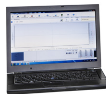
SepacoreControl Software Software de control total