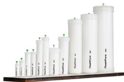
FlashPure Cartridges Ayudan a maximizar el rendimiento de los productos flash actuales