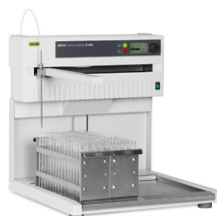
Fraction collector C-660 Raccolta delle frazioni