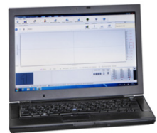
SepacoreControl Software 완전한 제어 소프트웨어