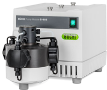
Pump Module C-601 / C-605 펌프 모듈