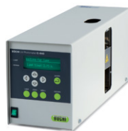
UV-Vis Detector C-640 Спектрофотометри- ческий детектор