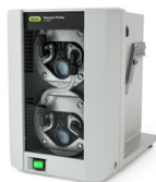
Pompa da Vuoto V-300

Evaporazione rotante pratica ed efficiente