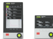
Interface I-300 / I-300 Pro

Per raffreddare in modo efficiente risparmiando acqua