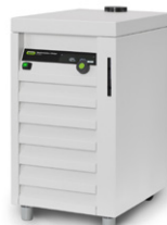
Refrigeratore a Ricircolo F-305 / F-308 / F-314

La fonte di vuoto più economica e silenziosa