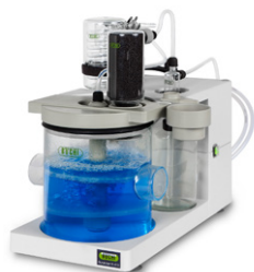
Scrubber K-415 中和装置