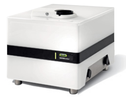
NIRMaster™ IP54 Spektroskopi FT-NIR dengan perlindungan ingress (Ingress Protection-IP)