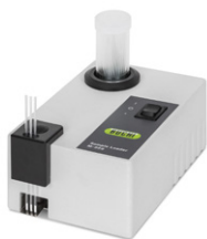
Sample Loader M-569 Pengemasan kapiler yang efisien