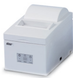
Star Printer Pencetak seri