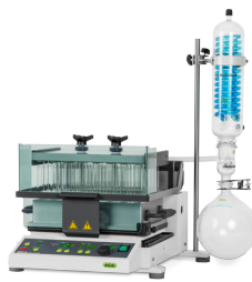
Syncore® Polyvap Análise de amostras múltiplas