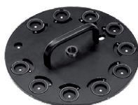
Amostrador para 10 comprimidos