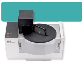
NIRFlex Solids Transmittance