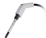
Fibra Óptica para Sólidos