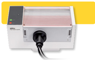
NIRFlex Fiber Optic