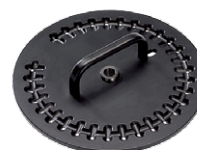
Amostrador para 30 cápsulas