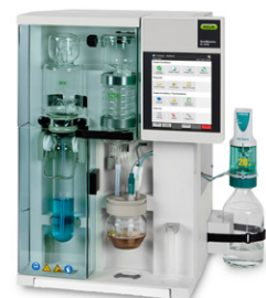
KjelMaster K-375 Distilasi dan titrasi