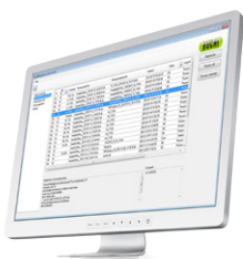
NIRAnywhere Software Solusi jaringan