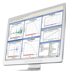
NIRCal® Software Pengembangan kalibrasi secara kemometrik