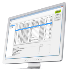
NIRAnywhere Software Solución en red