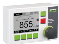
Vacuum Controller V-850 / V-855 Mencapai kinerja proses terbaik