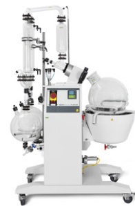
Rotavapor® R-250 EX Proteksi EX memenuhi tingkat keamanan tertinggi