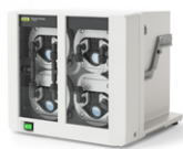
Vacuum Pump V-600 Sumber vakum bertenaga dan tenang