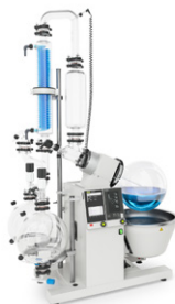
Rotavapor® R-220 Pro Skala produksi dengan performa terbaik