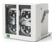
Vacuum Pump V-600 强大安静的真空源