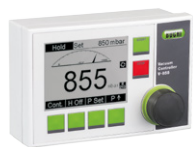
Vacuum Controller V-850 / V-855 实现最佳的过程性能