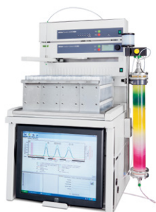
Sepacore® X10 / X50 Sistema de cromatografía flash