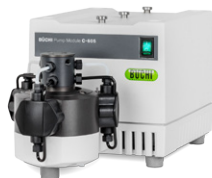
Pump Module C-601 / C-605 Bomba