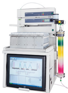
Sepacore® X10 / X50 Sistema de cromatografia flash