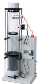
Nano Spray Dryer B-90

Лучшая в мире лабораторная распылительная сушилка