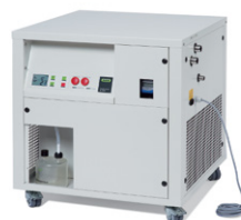
Inert Loop B-295

Распылительная сушилка для образцов небольшого объема и частиц