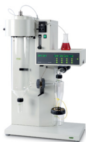
Mini Spray Dryer B-290

Лучшая в мире лабораторная распылительная сушилка