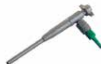
アスピレーターの代りに